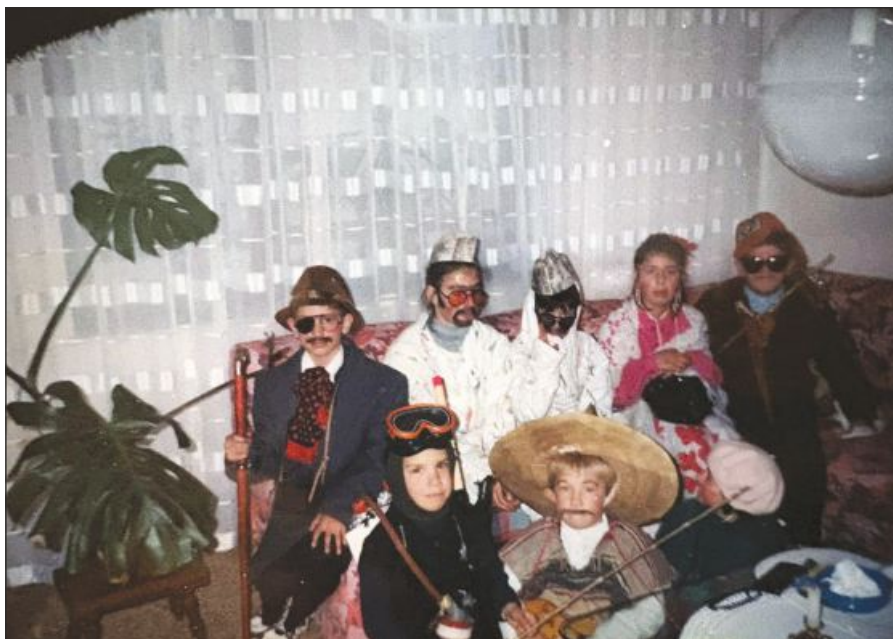
MAŠKARE NEKADA I MAŠKARE SADA